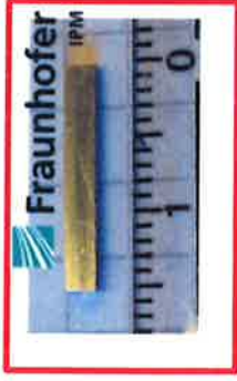
Bi - doped PbTe